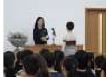
【移転記念式典の様子】

3学期は、新校舎でのスタートとなりました。新校舎では、まず、移転記念式典を行いました。大連領事事務所の所長様を始め、学校理事会の理事長様、理事会の方々、PTA会長様にもご出席いただきました。式典の中で生徒会会長さんから、「旧校舎との別れは少し寂しいけれど、先輩から受け継いできた良い伝統を守りつつ、新しいことにもチャレンジしながら、新校舎で学校生活を送っていきたい」という挨拶がありました。新校舎にも愛着をもって過ごしてほしいと思います。